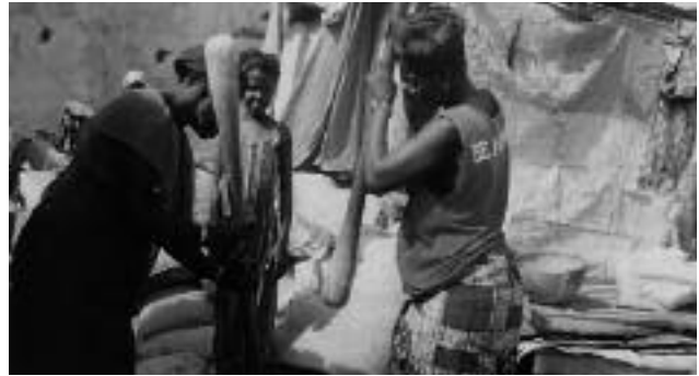
Figure 1 - Les femmes pileuses de mil à la Médina en plein travail.

Ces femmes étaient toutes analphabètes, de religion musulmane, et d'ethnie Sérère. Elles comptaient 90% de mariées, 6% de filles mères et 4% de veuves ; et 66% avaient un séjour de plus de 10 ans. Le nombre d'enfants par femme, variable de 1 à 12, était supérieur à 3 pour 44 (88%) ; et le nombre d'enfants désirés par femme variable de 2 à 14, supérieur à 5 pour 48 (96%). La contraception, désirée par 36 des 50 femmes pileuses de mil (72%), n'a été utilisée que par 8 d'entre elles (16%). Les méthodes comprenaient 5 traditionnelles (10%) et 3 modernes (6%) : 1 pilule et 2 injectables. Les avantages de la PF, cités par 37 d'entre elles, portaient sur le repos de la femme (18=36%), le bon