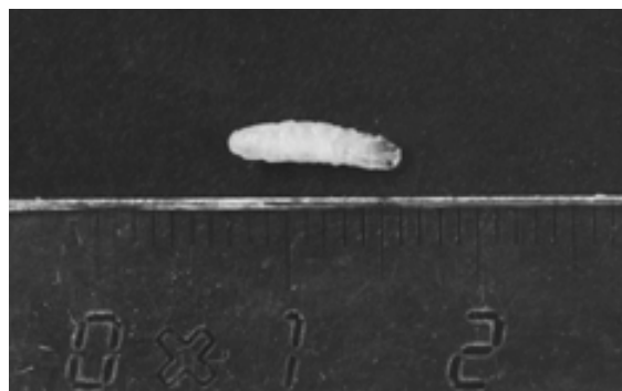
Figure 1 - Larve de Cordylobia anthropophaga .

Mounia G., originaire de la région de Tiflet, ville située dans le Moyen Atlas à 100 Km de Rabat, sans antécédents particuliers, présentait depuis une dizaine de jours un nodule sur le cuir chevelu. Il était d'aspect rouge-violacé, douloureux et enflammé simulant un furoncle. A force de gratter, la lésion laissait échapper un petit ver d'allure chamue. L'hémogramme pratiqué le même jour montrait une hyperéosinophilie chiffrée à 1 860 polynucléaires éosinophiles par mm 3 . La plaie ayant donné issue à l'élément parasitaire était en voie de cicatrisation. Le ver recueilli (Fig. 1) était de forme ovulaire, mesurant 8 mm de long sur 3 mm de large, de couleur blanc sale. Le corps était constitué de douze segments parsemés d'épines noirâtres. La tête était arrondie, réduite et présentait une paire de crochets buccaux. Le dernier anneau était arondi ; il était le siège de deux plaques stigmatiques portant chacune trois fentes d'allure curviligne. Le diagnostic retenu était celui de myiase furonculeuse à Cordylobia anthropophaga ou « ver de Cayor » encore appelé par les anglo-saxons African tumbu fly (2).